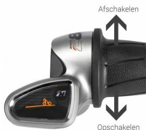
Afb. 2: C8 shifter NuVinci