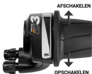
Afb. 1: C3 shifter NuVinci

N.b.: Het NuVinci-systeem is traploos, zodoende zal de shifter gradueel van stand veranderen i.p.v. in stappen.