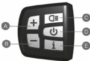
Afb. 3: Bedieningspaneel

Zodra de accu is vergrendeld, kan het computersysteem ingeschakeld worden, met de aan/uit-knop op het bedieningspaneel.