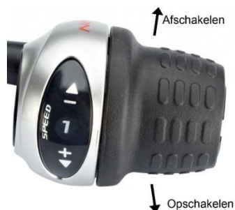
Afb. 2: Versnelling

Uw fiets is uitgerust met een accu die de motor en het besturingssysteem van energie voorziet. De fiets geeft elektrische ondersteuning zodra u de trappers laat draaien.