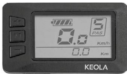
Afb. 4: Display